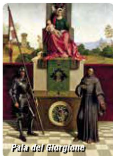
Pala del Giorgione